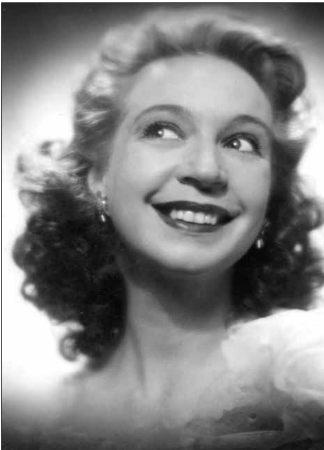
Skuespilleren skaper sin rollefigur etter instruksjon fra regissøren, men med god hjelp fra sminkøren, kostymedesigneren og lysdesigneren. På bildet: Wenche Foss.

Hos Norsk filminstitutt kan du leie eller kjøpe hefter og videoer som gir gode tips dersom klassen vil lage film. Filmintituttet arrangerer også årlig Amandus – en video- og manuskonkurranse for barn og unge.