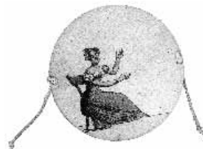
Thaumatrop (optisk leketøy)