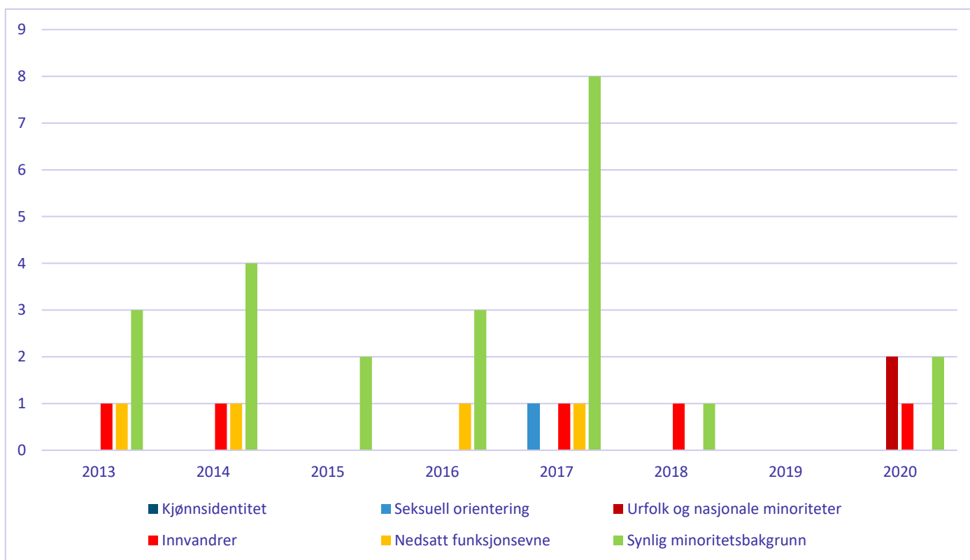
Figur 1 - Hovedroller i norske kinofilmer, 2013-2020

Som tidligere nevnt var det ikke noen filmer med en hovedrolle som falt inn under kategorien annen kjønnsidentitet, men den eneste filmen med en ikke-heterofil hovedrolle hadde premiere i 2017. Videre ble det for første gang i 2020 observert to filmer som hadde urfolk og nasjonale minoriteter i hovedrollene.